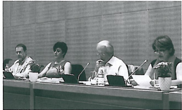
ΣΤΙΓΜΙΟΤΥΠΑ από την ημερίδα του περασμένου Σαββάτου.